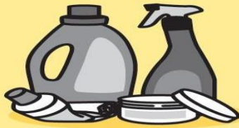
OBALY OD KOSMETICKÝCH A HYGIENICKÝCH POTŘEB