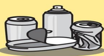
KONZERVY A PLECHOVKY OD POTRAVIN A KOSMETIKY