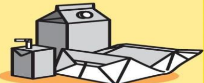
SEŠLÁPNUTÉ NÁPOJOVÉ KARTONY