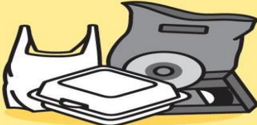
SÁČKY, FÓLIE, CD, DVD, VHS MÉDIA, POLYSTYRÉN