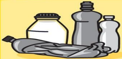
SEŠLÁPNUTÉ PET LÁHVE