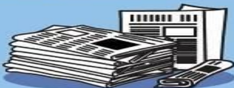
NOVINY, ČASOPISY, REKLAMNÍ KATALOGY A LETÁKY