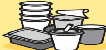
KELÍMKY A KRABÍČKY OD POKRMŮ