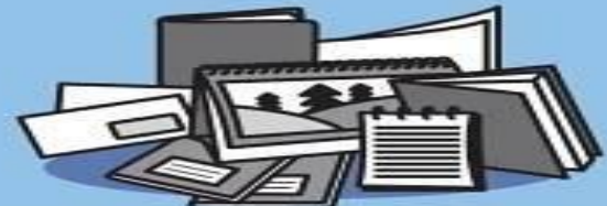
KANCELÁŘSKÝ PAPÍR, SEŠITY, BLOKY, KALENDÁŘE, KNIHY, BROŽURY, VÝKRESY, OBÁLKY