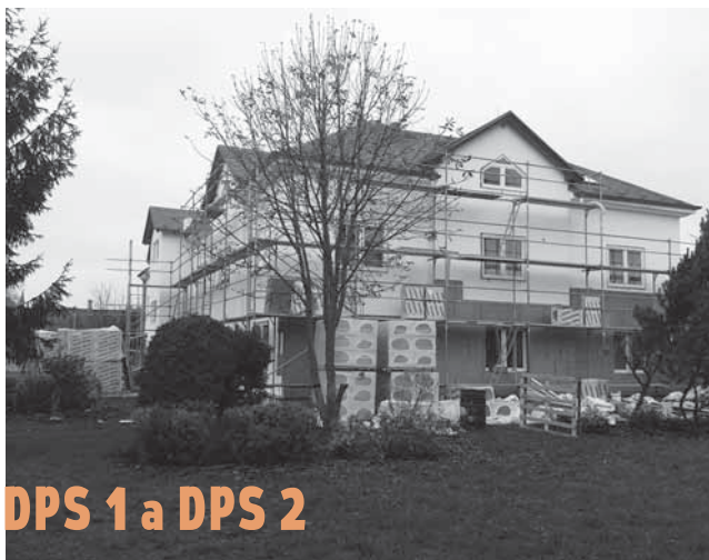
DPS 1 a DPS 2